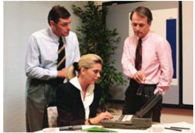
Internationale Expertenteams projektieren bei UCY für Ihren Erfolg